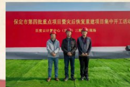
该项目是百度全国云计算战略布局中的重要一环。为确保工程质量，大队

龙年新篇章，启航新征程。新年钟声尚未远去，工勘公司迎来签约喜讯，落地省重点项目百度云计算中心（定兴、徐水大店）三、四期桩基工程项目，合同额1600余万元，以“开门红”点亮“全年红”。