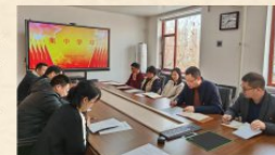
管线勘测工程院党支部

深入学习贯彻习近平总书记视察天津重要讲话精神，结合党支部实际，牢牢把握各项决策部署，持续发扬钉钉子精神，把学习成效体现在韧性安全城市建设上，充分发挥技术优势，为城市建设提供完善的建设方案、精确的数据基础、高质量的建设成果；同时创新升级软件产品，发挥“空天地一体化”优势，拓展更多应用场景，坚定不移走市场化道路，坚持实用创新的原则，推动成果持续转化，为“两力”新华助建设贡献“智慧”力量。