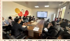
九华地信空间(天津)科技有限责任公司党支部

要牢牢把握新时代新征程习近平总书记对天津工作的一系列重要指示要求，围绕提升城市治理现代化水平要求，支撑服务好“地下一座城市”，积极开拓市政基础设施普查、清淤检测、非开挖修复等业务，增强安全保障和防范化解风险能力，为韧性安全城市建设贡献力量；要建强支部战斗堡垒，定期组织党员加强思想和技术学习，建强专业化人才队伍，更好服务管线行业。