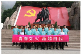
青春如火 超越自我

为了让新员工更快适应新环境，融入团队生活，完成角色转变，明确自身角色定位，在大队党委领导下，人事等相关部门认真研究制定了新员工培训活动方案。精心设计各项课程和行程安排，设计制作《新员工入职手册》。