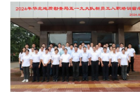
2024年华北地质勘查局五一九大队新员工入职培训活动

通过此次丰富多彩的培训活动，新员工们进一步明确了自己的工作定位和目标，激发了创新创业活力，迅速完成了从“相聚”“相知”到“相融”的转变。在人生的全新起跑线上，全面开启崭新的职业生涯，满怀对未来的美好憧憬，擎起发展大旗，扛起发展责任，不负时代，不负韶华，谱写青春新的奋斗华章！